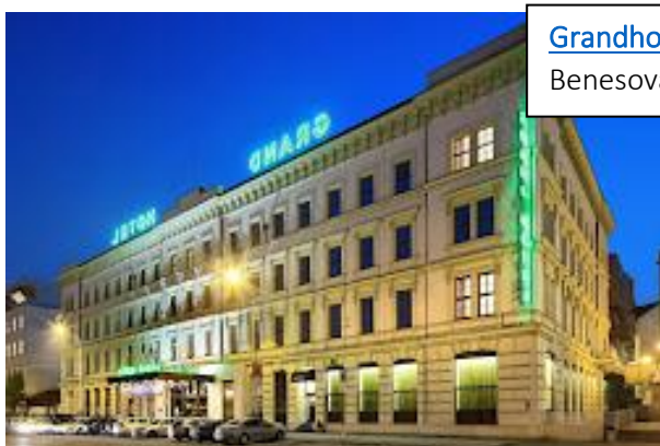
Grandhotel Brno**** Benesova 605/18, 602 00 Brno