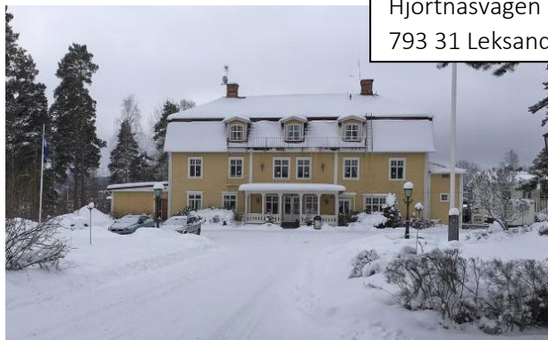
Korstäppans Herrgård*** Hjortnäsvägen 33 793 31 Leksand

Dalecarlia Hotel & Spa med anor från 1910 ligger högt uppe i Tällberg med en vidunderlig utsikt över den mytomspunna Siljan. Tällberg är en mysig by som är belägen mitt emellan Rättvik och Leksand. Dalecarlia är ett modernt hotell med konferens, restaurang samt ett fint Spa med hela 1500 kvm njutning. Entré till relaxområdet är avgiftsbelagd.