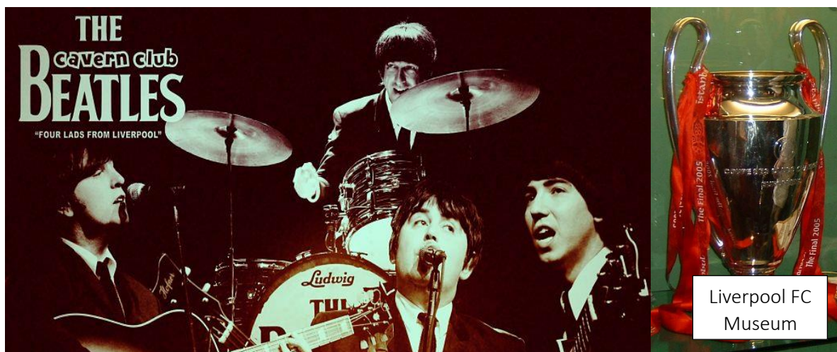
Liverpool FC Museum