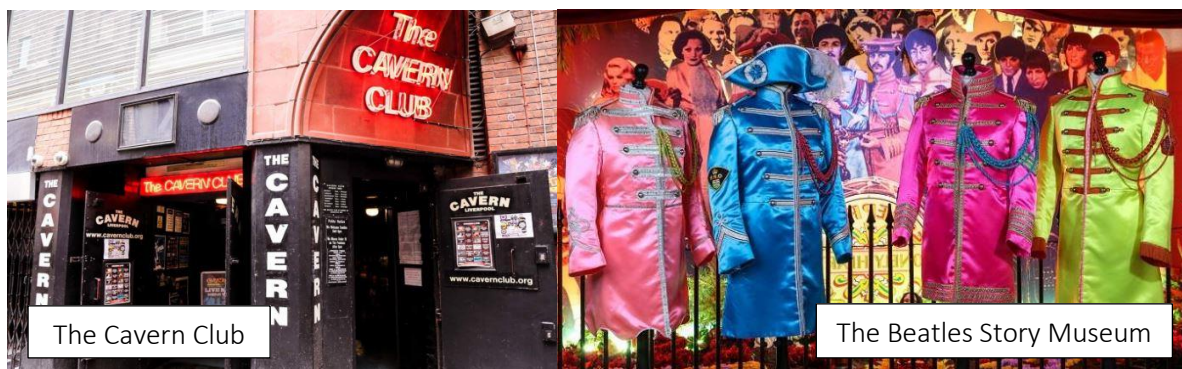
The Cavern Club