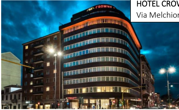
HOTEL CROWN PLAZA MILAN CITY **** Via Melchiorre Gioia 73, 20124 Milano.