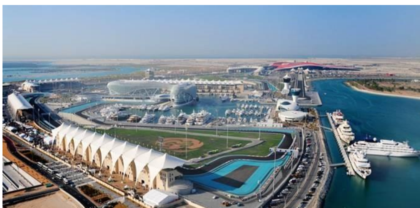
Yas Marina Circuit

Lördag 28 november Frukost. Transfer till Abu Dhabi och Yas Marina Circuit. Tidsträning och kvalificering till Abu Dhabis Grand Prix 2015. Transfer tillbaka till hotellet